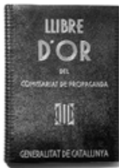
Llibre d'Or del Comissariat de Propaganda (1937-1938), Ingressat a l'ANC el dia 3 maig 2000

Àrea dels fons de l'Administració: Generalitat de Catalunya (II República), Llibre d'Or del Comissariat de Propaganda, (1937-1938); Generalitat de Catalunya. Departament de la Presidència, Llibre de Disposicions del Govern de la Generalitat, (1989-1990); traduccions al castellà de les disposicions de la Generalitat de Catalunya, (1990), 5,8 metres; Junta Electoral de Zona de Barcelona, actes de constitució de les meses, credencials, interventors i renunciés de les eleccions a Corts Generals de 12 de març de 2000 i de les eleccions al Parlament de Catalunya de 17 d'octubre de 1999, 8 m lineals; 48 cartells dels partits polítics participants a les eleccions municipals i al Parlament Europeu de 13 de juny de 1999; 17 cartells dels partits polítics participants a les eleccions al Parlament de Catalunya de 17 d'octubre de 1999; 589 cartells de propagan-