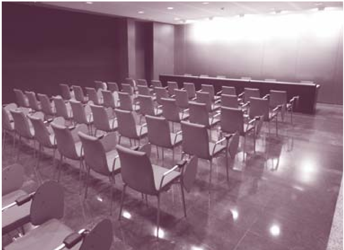
Nova seu de l'Arxiu Històric de Lleida